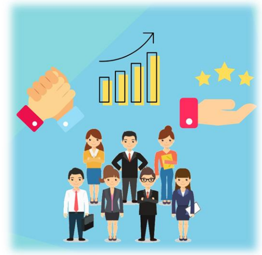
Asesorías Empresariales Personalizadas