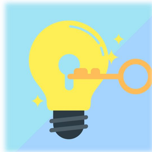
Soluciones Empresariales Express